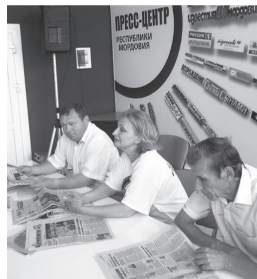
Саранск. С главными редакторами «Мокшень правда» и «Эрзянь правда».