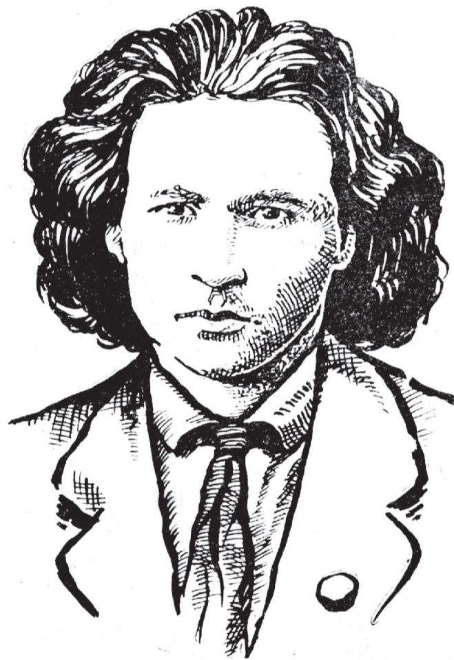
И. М. ВАРЕЙКИС.

Тематика его статей была самой разнообразной. Тут и передовицы на важнейшие темы текущего момента, и специальные статьи по вопросам международного и внутреннего положения Советской республики, и, наряду с ними, статьи «о неотложных задачах» по улучшению материального положения трудящихся губернии. Многие его статьи поднимались на уровень острых политических памфлетов, изобличающих врагов пролетарской революции и диктатуры пролетариата. Он горячо про-