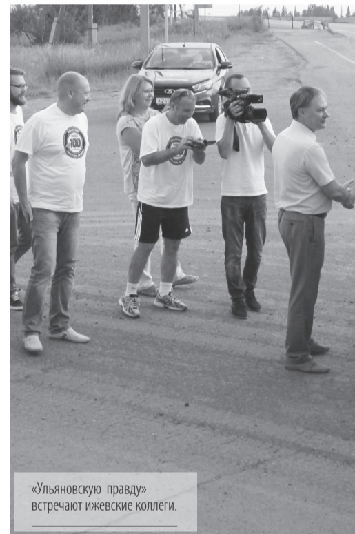
«Ульяновскую правду» встречают ижевские коллеги.